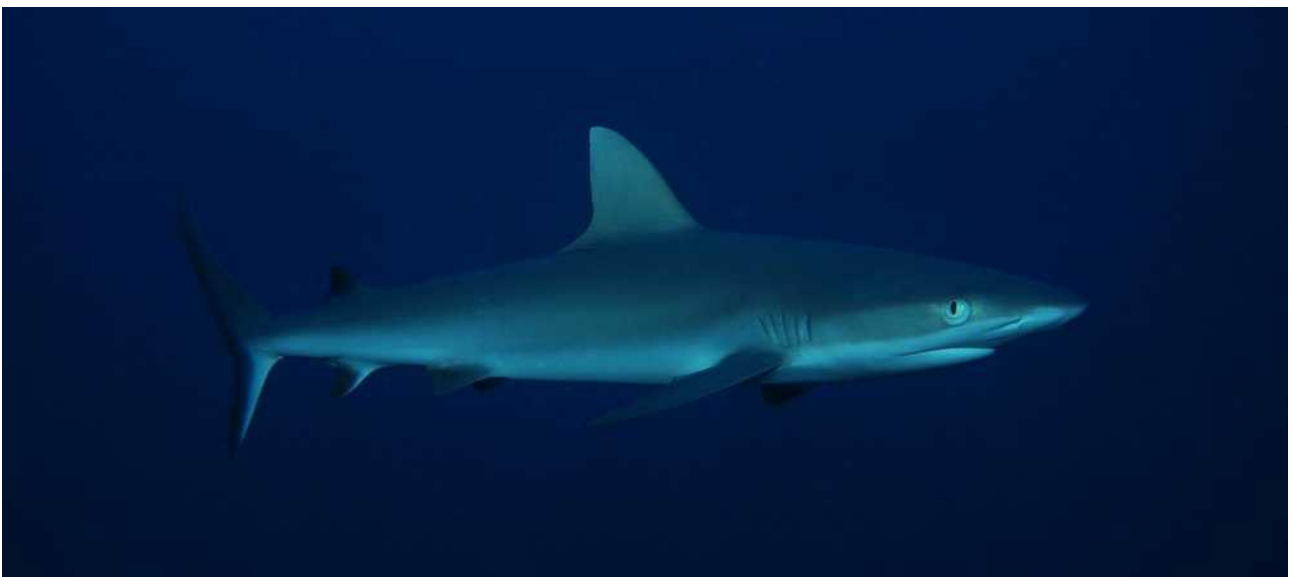
Een grijze rifhaai die Jimmy nieuwsgierig komt bekijken

Mooier kan het toch niet?! Het contrast met de Solomon Islands, een eilandnatie die zijn weg nog moet vinden, is groot en er gaat een enorme golf van dankbaarheid door mij heen. Want we hebben het maar goed in Nederland, al zouden we nog veel kunnen leren van de mensen en het simpele leven hier! Iedereen kijkt elkaar aan en neemt op wat ze zien, vriendelijkheid en behulpzaamheid is de regel en de simpele kostbaarheden die men heeft, worden gedeeld.