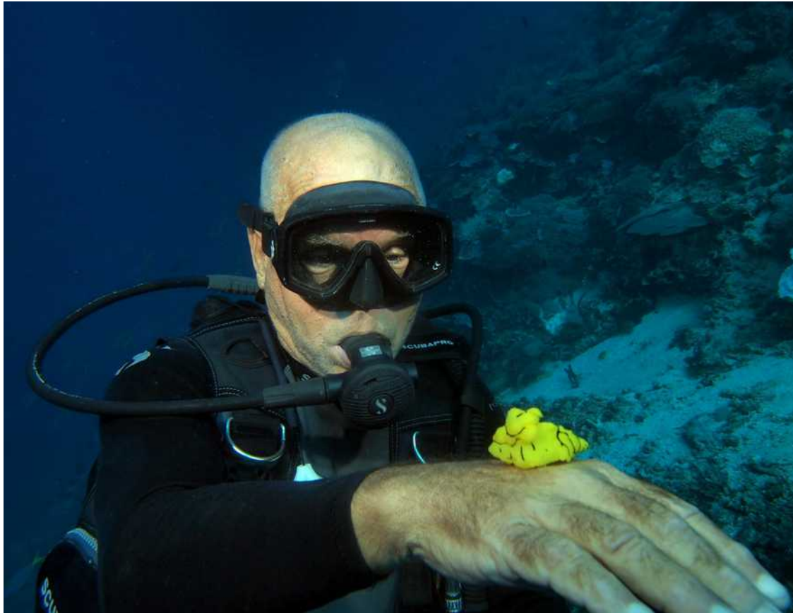
En tijdens een duik aan de buitenkant van het rif vinden we dit mooie naaktslakje, een Banana nudibranch'

De oversteek naar San Cristobal eiland doen we in een nachtje en na stops in twee riffen ten noorden van San Cristobal komen we in Star Harbour aan, op de oostpunt van San Cristobal. Dat is het startpunt voor onze oversteek naar Indispensible, een afgelegen rif in de Solomon Sea.