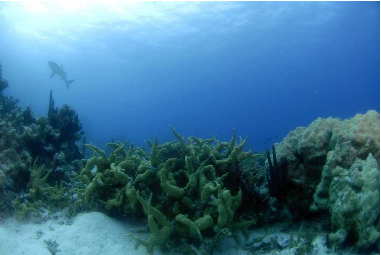
Onderwaterlandschap in Middle Reef van Indispensable met een nieuwsgierige grijze rifhaai die de fotograaf komt bekijken

Jimmy heeft het voorrecht om in de passage van Middle Reef te kunnen duiken terwijl Diederik en ik met ALK in wind en stroming in de buurt blijven. Hij beschrijft zijn ervaring als volgt: