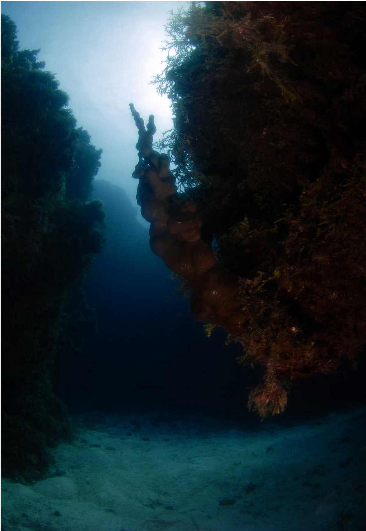
Onderwaterlandschap in Indispensible