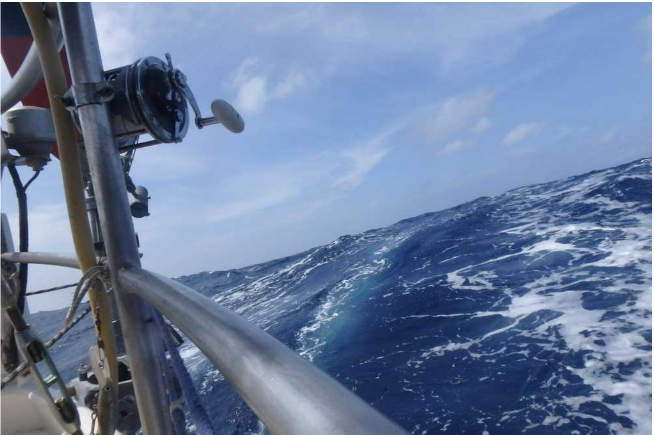
De Solomon Sea in 7Bft

Na onze ochtendduik maken we ALK klaar voor de oversteek naar Alotau, meer dan 800M. Onderweg hebben we tijd genoeg om na te kunnen genieten van deze bijzondere plek. Maar niet voor lang want het zeilen vraagt alle aandacht. De ZO waait onafgebroken met 6 tot 7Bft en de tweede nacht van de oversteek hebben we urenlang zelfs 8Bft in een groot onweersgebied. De golven bouwen zich op en toornen hoog boven de hek van ALK uit tot ze ons inhalen.