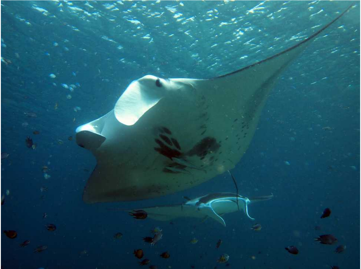
Manta's bij Sideia Island

De manta's vertrokken weer na een dik uur en voor ons is het ook tijd verder te gaan. Alotau is nog maar 30M en aan het eind van de dag laten we het anker vallen voor het Airways Hotel. De inklaring de volgende dag is een snel gepiept. Bij het kantoor van Customs hoef ik maar één formuliertje in te vullen en voor de visa hoef ik niet naar Immigration. Met een half uurtje ben ik klaar!