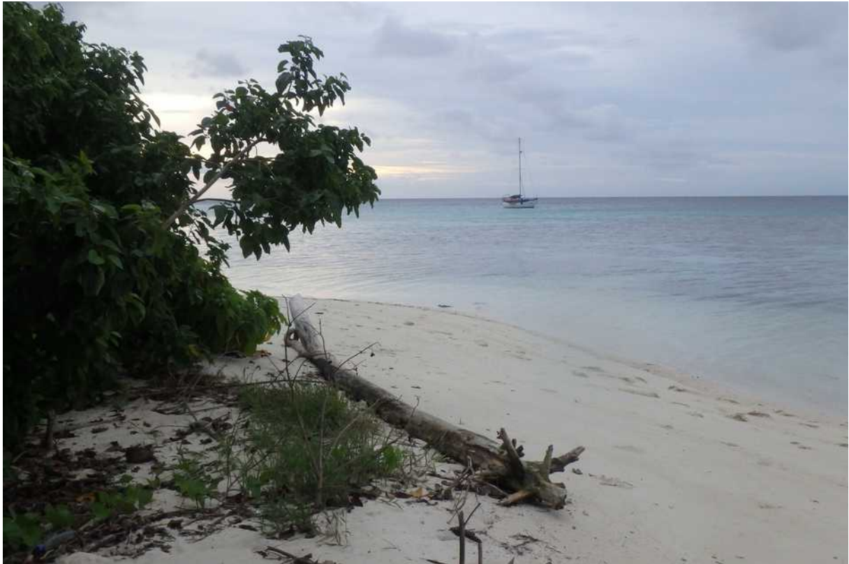
Voor anker bij Boiaboawaga eiland

Hun rust wordt alleen verstoord door een paar zeearenden. Als die over de toppen van de bomen scheren, vliegen de fruit bats en masse op en zijn dan een gemakkelijke prooi.