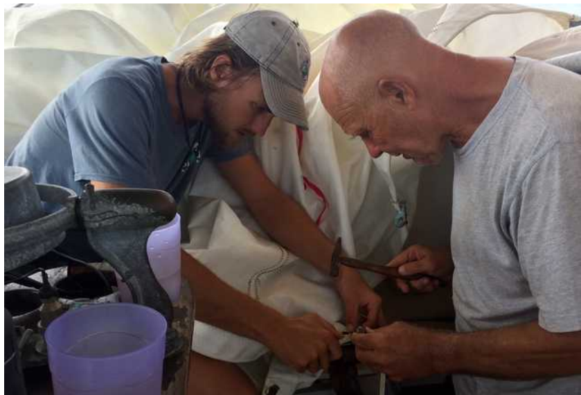
De kuip is even getransformeerd tot zeilmakerij

Het weer is niet uitnodigend om te duiken en er liggen ook een paar klussen op ons te wachten. De eerste dag proberen we vergeefs het startkoord van de compressor te repareren en de fok moet ook nodig onderhanden worden genomen.