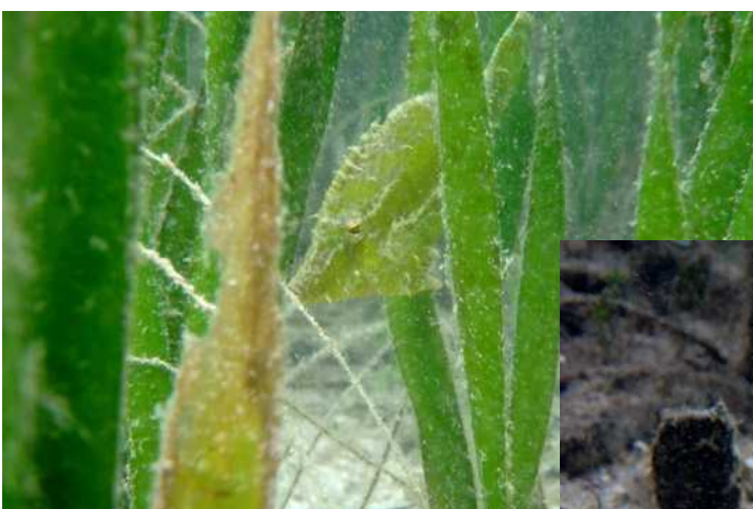
Een 'Bristled-tailed filefish