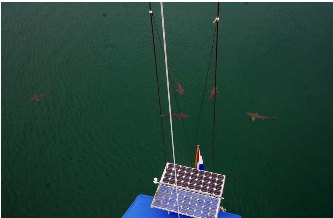
Je zou er bang van worden, al die hongerige haaien om ons heen

De volgende dag blijkt het ondiepe water rond het eilandje helemaal vol te zitten met flinke scholen uit de kluiten gewassen mangrove snappers, geel gestreepte makrelen, giant trevallies en kleinere vissen en zwarttip rifhaaien. Een gegeven moment kan Jimmy er vanuit de mast 13 zien rondcirkelen om ALK. Dat heb ik nog nooit meegemaakt!