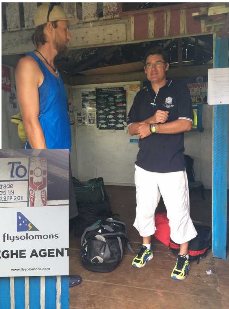
De 'vertrekhal' van Seghe.