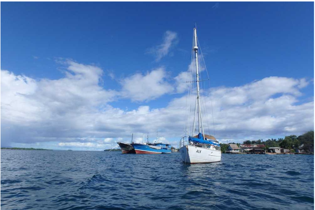
Voor anker in de baai van Gizo

Als het anker is gevallen komt er weer rust over me. De troep en nattigheid binnen laat ik voor wat het is en we pakken een biertje om bij te kletsen. Aan gespreksstof geen gebrek!